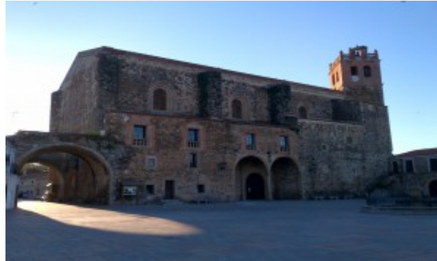
Figura 3. Iglesia Parroquial de Jaraicejo. Fachada meridional.