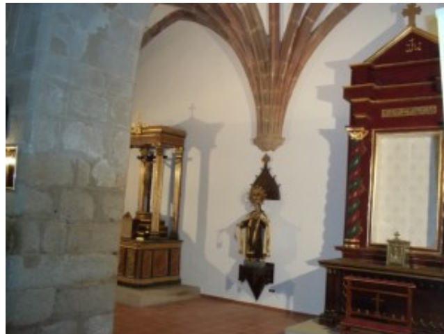
Figura 4. Capillas del lado del Evangelio.