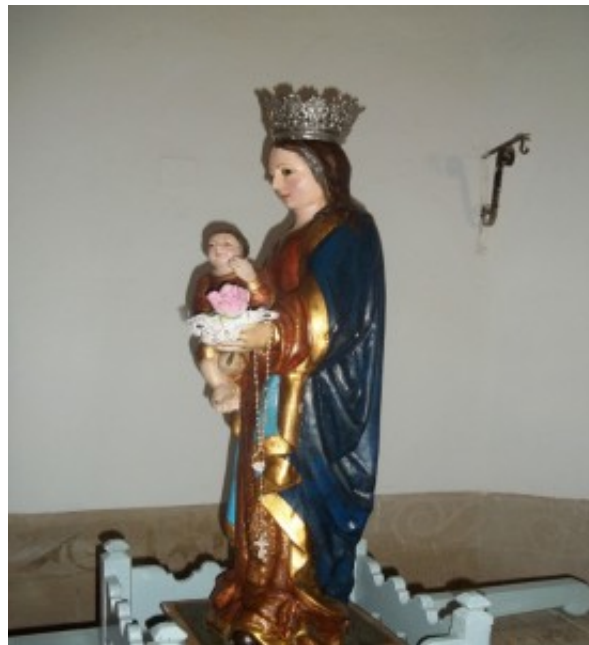
Figura 2. Imagen Nuestra Señora de los Hitos.

La talla de la Virgen de los Hitos es una talla en madera policromada de la Virgen con niño en su mano derecha, sobre peana. La Virgen mira al frente y el niño posee piernas entrecruzadas y su mano izquierda en actitud de bendecir. La Virgen en su mano izquierda posee una flor que en otro tiempo portaba un báculo y a su vez de su mano pende un rosario. Según algunos historiadores, la talla está fechada a finales del siglo XV. [27]