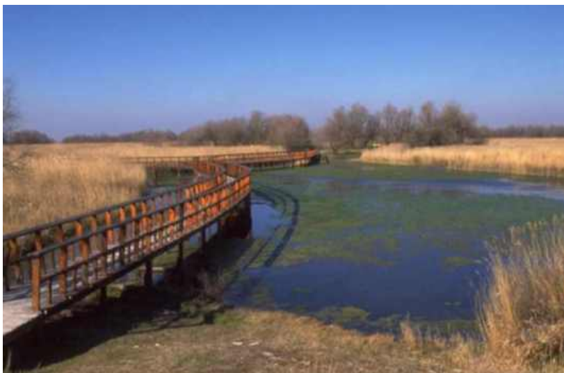
Fig. 29. Pasarelas de madera del Parque Nacional de Las Tablas de Daimiel

El Parque Nacional de las Tablas de Daimiel es una gran planicie, levemente ondulada y alimentada por dos ríos, el Guadiana y el Cigüela, el primero de agua dulce y el segundo salobre, lo que