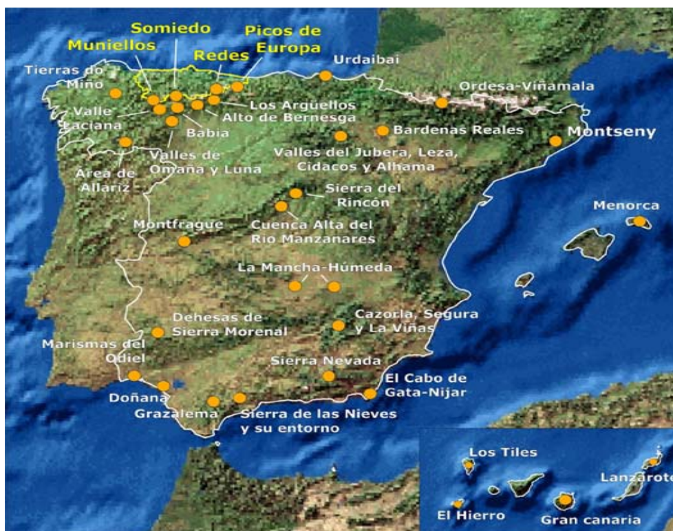
Fig. 5 Reservas de la Biosfera en España

dehesas, marismas,...Estando representadas las 4 regiones biogeográficas que alberga nuestro país: Alpina, Mediterránea, Atlántica y Macaronésica.