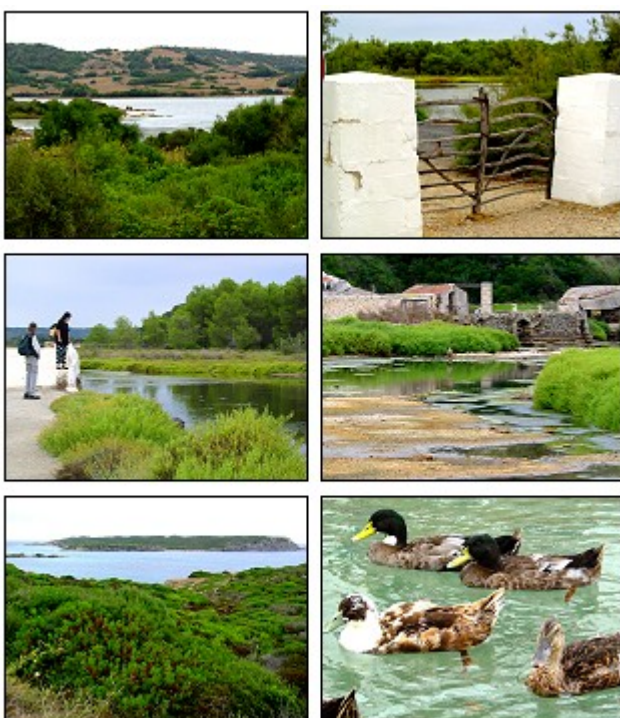
Fig. 18. Vistas de la Albufera de Grau

La principal característica del medio natural de Menorca es la diversidad ambiental existente. Así, la isla ofrece la posibilidad de encontrar una representación de casi todos los hábitats propios del Mediterráneo como son: Los barrancos característico del sur de la isla; Las cuevas , Menorca cuenta con medio centenar de grutas terrestres y una decena de cuevas submarinas que se ubican en las zonas norte y sur de la isla.; Las zonas húmedas integradas