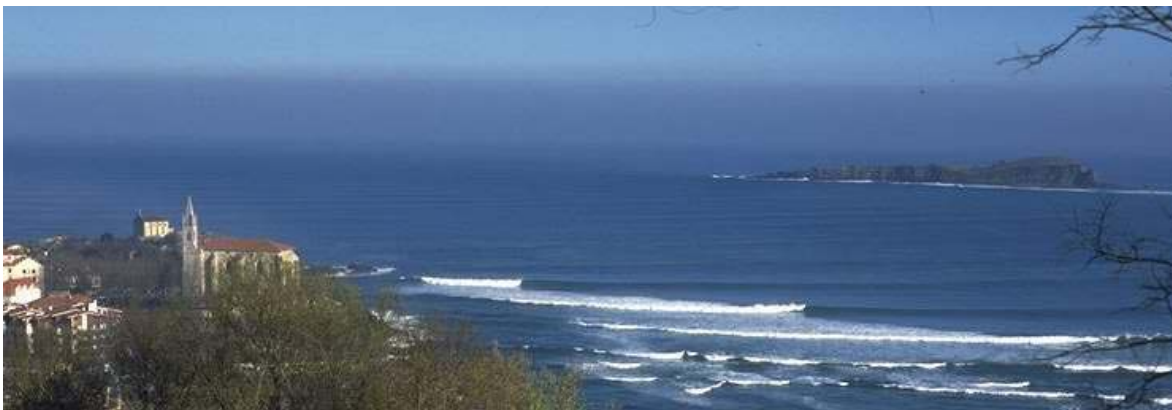
Fig. 10. Isla de Izaro, en el centro de la ría de Mundaka

desde hace siglos centralizan la actividad económica de la comarca: Gernika , situada en el centro geográfico del territorio, nudo de comunicaciones e intercambio comercial, y Bermeo (fig. 9), que ha crecido vinculada estrechamente al mar, convirtiéndose en el puerto de bajura más importante de la cornisa cantábrica. El resto del territorio posee múltiples asentamientos humanos, todos ellos de tipo rural y/o marinero formando una población de 45.000 habitantes en la comarca.