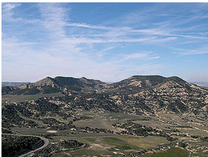
Fig. 17. Bardena negra

-La Bardena Negra (fig 17): se caracteriza por su relieve formado por mesetas de distintas alturas y está surcada por una densa red de barrancos con fondos estrechos. En su paisaje destacan los campos de cultivos cerealistas, que ocupan las zonas llanas, y los coscojares y pinares que bordean los llanos. Es la zona con mayor cobertura vegetal de las Bardenas, que se manifiesta en forma de bosque mediterráneo.