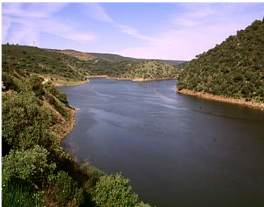
Fig. 23. Río Tajo a su paso por Monfragüe.

La Reserva de la Biosfera de Monfragüe ocupa una superficie de 116.000 hectáreas y se localiza a ambos márgenes del río Tajo en el centro de la provincia de Cáceres. La integra el entorno del Tajo (fig. 23) y el del Tiétar, además de en una red no muy densa de pequeños arroyos que vierten a ellos.