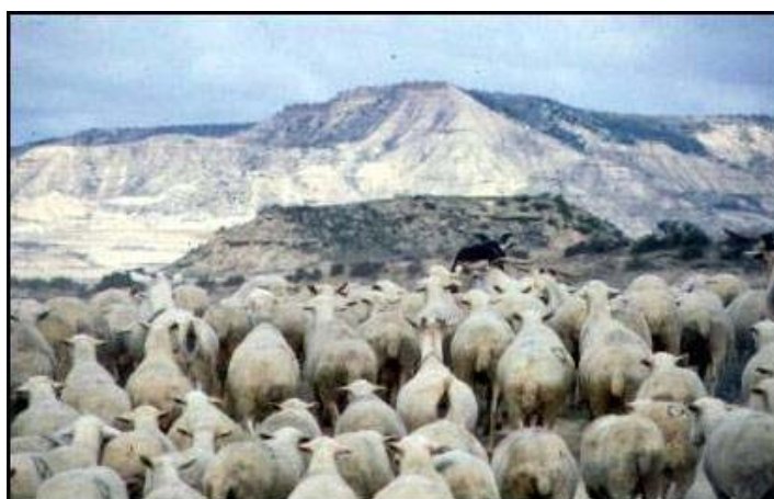
Fig. 14. Rebaños a su paso por las Bardenas Reales

Este territorio perteneció a la corona de Navarra que otorgó su uso para pastos de invierno de los rebaños de ovino (Fig.14) de los valles pirenaicos de Salazar y Roncal. Dichos valles todavía mantienen esta práctica renovada cada año el 18 de