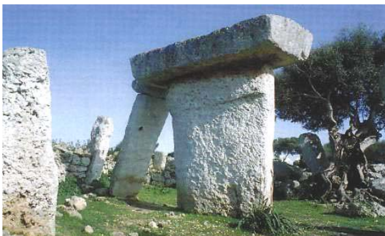
Fig. 19. Taula de Dalt

En primavera la isla es una explosión de colores cuando los campos se visten de