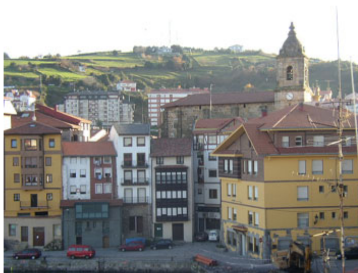
Fig. 9. Población de Bermeo.

La reserva reúne también condiciones muy favorables para los grandes mamíferos, dándose cita numerosas especies, algunas de ellas de elevado interés. La calidad del medio y variedad de ambientes permite la presencia de numerosos carnívoros, que encuentran sobre