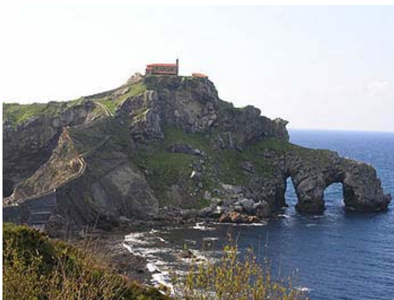
Fig. 11. San Juan de Gaztelugatxe

En la entrada de la ría se encuentra la isla de Izaro (fig 10), un islote poblado de gaviotas que fue motivo de litigio entre los habitantes de Mundaka y los de Bermeo. Para resolver el conflicto, decidieron jugárselo a una regata en la que resultaron vencedores los bermeanos. Estos celebran su victoria el