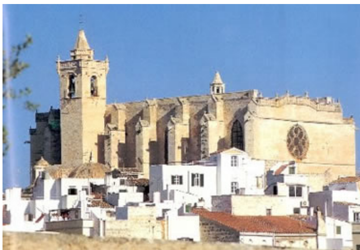
Fig. 21. Catedral de Ciutadella

- El fuerte de Sant Felipe a la entrada del Puerto de Maó y algunas de las torres de defensa de la costa como la de Sant Nicolau en Ciutadella. Construidas en época de Felipe II para hacer frente a los ataques turcos