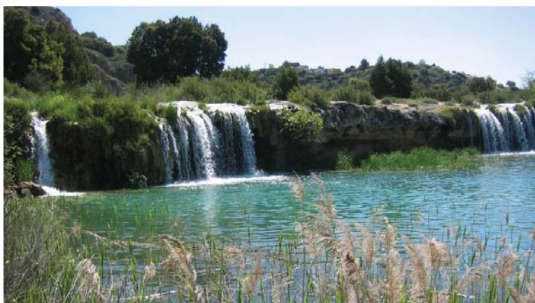
Fig. 30. Lagunas de Ruidera.

Estos humedales son excepcionales por la avifauna que anida e hiberna como los colimbos de cuello negro, la garza purpúrea, espátula y una amplia variedad de otras aves acuáticas. Las raras especies existentes incluyen la espátula blanca, el flamenco