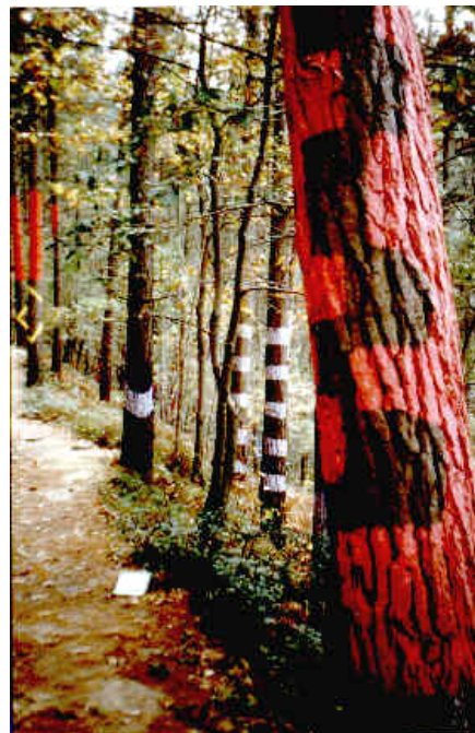
Fig. 12. Bosque Pintado. Agustín Ibarrola

El pequeño municipio de Kortezubi, enclavado dentro de la Reserva de la Biosfera de Urdaibai, reúne dos de las principales atracciones de la oferta turística del territorio vizcaíno: las cuevas de Santimamiñe, con su arte rupestre, y el Bosque Pintado de Agustín Ibarrola (fig. 12), ubicado en el valle de Oma.