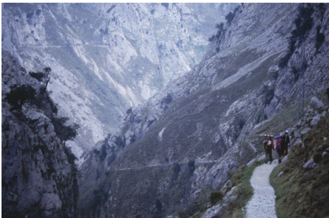
Fig. 4 . Reserva de la biosfera Picos de Europa

El programa MaB (Man and Biosphere), tiene como fin la declaración en todo el mundo de las llamadas Reservas de la Biosfera. Esta red mundial esta dividida en diferentes redes participando España en la La Red IberoMab , fundada en 1.987, con la participación de los países iberoamericanos, Portugal y España.