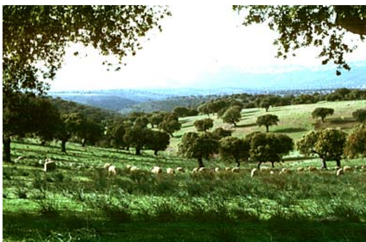
Fig. 25. La Dehesa es uno de los paisajes característicos de Monfragüe.

El reconocimiento concedido por el Comité Hombre y Biosfera de la UNESCO en Julio del año 2003, no sólo reconoce el excepcional valor ecológico que, tanto en flora y fauna, posee Monfragüe y las dehesas que lo circundan, si no también que existe un modelo real de desarrollo