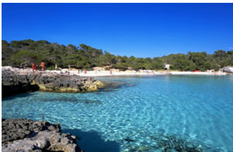
Fig. 20. Cala Turqueta