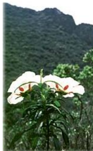
Fig. 26. Flor de Jara.

La flora y vegetación de Monfragüe están condicionadas por los dos factores físicos más importantes para las plantas: el clima y el suelo. El clima es mediterráneo, con fuertes sequías en épocas estivales y los suelos están constituidos por tierras silíceas caracterizadas por su pobreza y fragilidad ante la erosión.