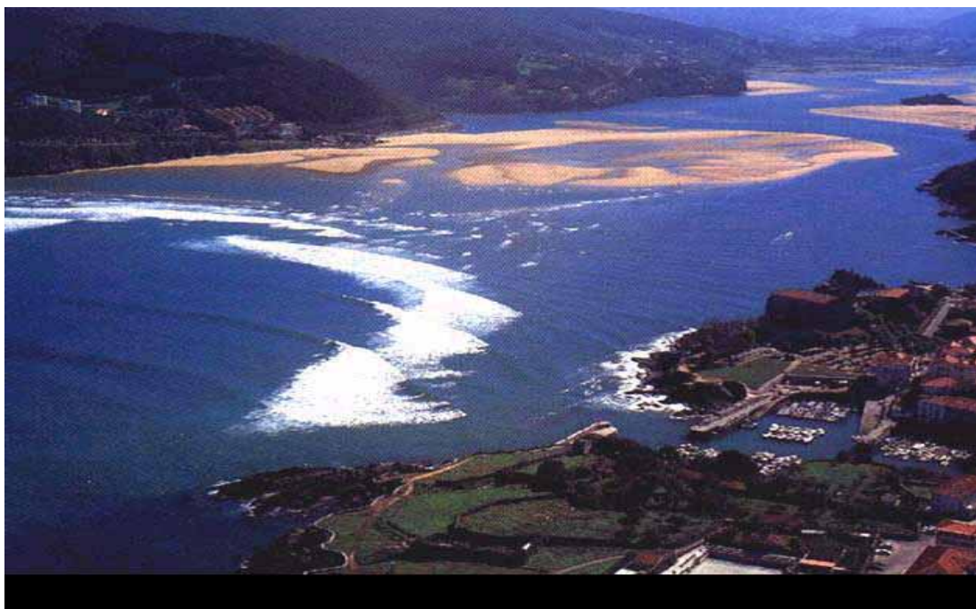
Fig. 7. Ría de Mundaka

El mar penetra en la costa de Vizcaya a lo largo de 13 Kilómetros formando la ría de Mundaka (fig. 7). En 1984, la UNESCO declaró Reserva de la Biosfera una extensión de 230 Kilómetros cuadrados en el entorno de la ría. La reserva se extiende en el entorno de Gernika, desde el cabo Matxixako hasta el Ogoño, en la costa, y se adentra hacia el interior de Vizcaya englobando un total de 22 municipios.