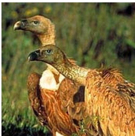
Fig. 27. Los buitres son una de las especies más representativas de Monfragüe.

Las especies arbóreas típicas son el alcornoque (fig. 24), las encinas y los quejigos, mientras que entre los arbustos hay que citar la cornicabra, el durillo, el madroño, los brezos y las jaras (fig. 26).