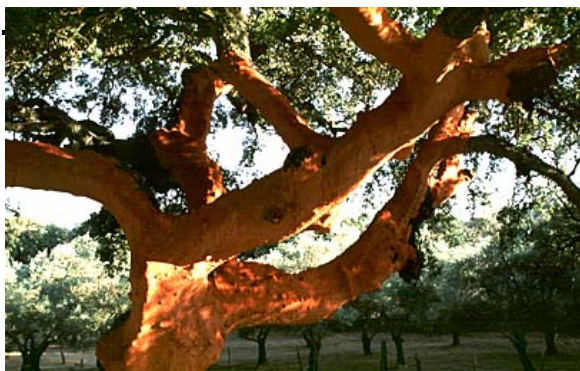
Fig. 24. Alcornoque, de cuya corteza se extrae el corcho

Plasencia y Jaraicejo, que convirtió la zona en estratégica y propicia al bandidaje, por lo que Carlos III mandó construir la aldea de Villarreal de San Carlos. Entre 1960 y 1970 se construyeron las presas de Torrejón y Alcántara, que detuvieron las aguas del Tajo y el Tiétar, pero hicieron