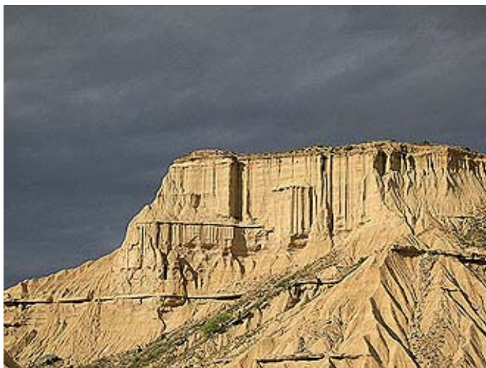
Fig. 15. Vista de las Bardenas

como la Sanmiguelada, que atrae a numeroso público. En tiempos de Felipe V, los pueblos del entorno de las Bardenas consolidaron los derechos de aprovechamiento de leña, lo que ocasionó la deforestación del terreno, y más tarde para la explotación cerealística, un uso que también hoy continúa.