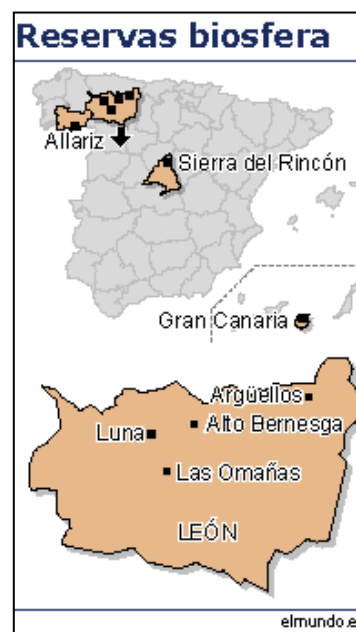
Fig. 6. Localizaciones de las Reservas incorporadas en 2005

En el 2001 la Red Mundial de Reservas de la Biosfera fue premiada con el premio Príncipe de Asturias de la Concordia . Este premio, le dio un valor añadido muy fuerte al sistema de reservas de biosfera.