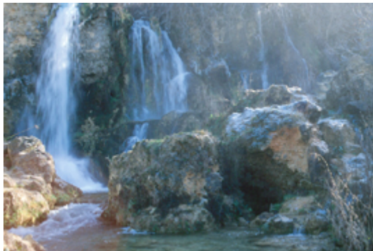
Fig. 31. Lagunas de Ruidera. Cascada entre dos lagunas

Se trata del último representante de un ecosistema denominado tablas fluviales, formación que se produce por el desbordamiento de los ríos Guadiana y Gigüela, favorecido por la escasez de pendiente en el terreno. Con su declaración como Parque Nacional en 1973 se dio un gran paso en la conservación de uno de los ecosistemas más valiosos de nuestro planeta, aunque actualmente se encuentra en grave peligro debido a la sobreexplotación del acuífero 23.