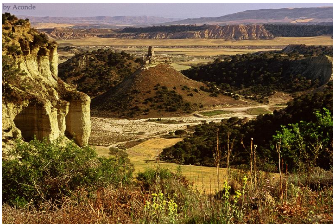
Fig. 18. Vista de las Bardenas Reales.

- El Rincón del Bú debe su nombre al búho real que cría en los cortados de este territorio. Esta reserva se localiza al sur de la Bardena Blanca y ocupa 460 hectáreas de barrancos, acantilados y cabezos cubiertos con sisallo y ontina que ofrecen un espectáculo de