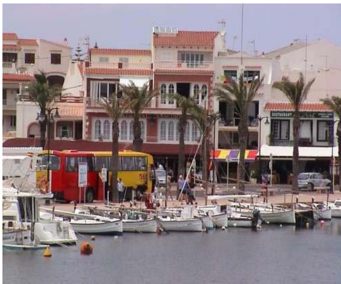
Fig. 22. Puerto de Fornells.

En 1713 como consecuencia de la Guerra de Sucesión al trono de España Menorca pasa a manos inglesas. Durante cien años la isla será inglesa con algunos cortos periodos de dominio francés y español. Los ingleses reforzaron las defensas construyendo más torres en la costa , como las que pueden verse en el puerto de Maó o Fornells, y el Fort Marlborough en la cala de San Esteban. La influencia inglesa también la encontramos en la arquitectura popular.