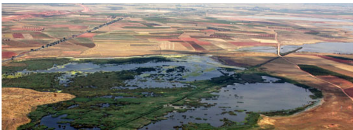
Fig. 33. Vista de la Reserva Natural del Complejo Lagunar de Alcázar de San Juan.

-En Alcazar de San Juan, La Reserva Natural del Complejo Lagunar de Alcázar de San Juan (fig. 33), que comprende las lagunas del camino de Villafranca, Las Yeguas y La Veguilla, está situado en la parte noreste de la provincia de Ciudad Real, lindando con la provincia de Toledo. La zona reúne varias figuras de protección: Refugio de Fauna de las Lagunas del Camino de Villafranca y las Yeguas; incluidas ambas en el Convenio sobre Humedales de Importancia Internacional como hábitat para Aves Acuáticas, RAMSAR; y