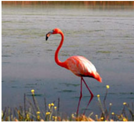
Fig. 34. Flamenco

Tiene un carácter estacional que se ha hecho más acusado debido al descenso de los niveles de acuíferos y la puesta en cultivo de pequeños lechos y arroyos que aflúan a la laguna. Sus