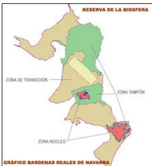
Fig.2 Zonas diferenciables en una Reserva de la Biosfera

Las Reservas de la Biosfera deben contener tres tipos de zonas(fig 2):