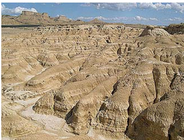
Fig. 16. Paisaje desértico en las Bardenas Reales

controlando el paso de los rebaños trashumantes. Este pasado no fue un sueño inventado,