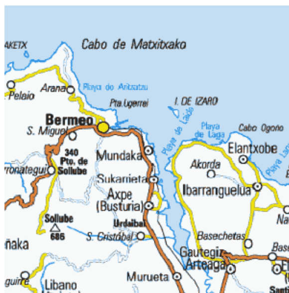
Fig. 8 Núcleos urbanos de la ría de Mundaka

Una de las riquezas ecológicas de Urdaibai es la abundancia de fauna avícola. Las marismas generan gran cantidad de invertebrados, moluscos y crustáceos que dan alimento a las aves, de las cuales algunas viven y nidifican en sus bosques y riberas y otras aprovechan sus ricos nutrientes para hacer un alto y reponer fuerzas en su recorrido hacia Africa o Centroeuropa, principalmente en los meses de septiembre-octubre y abril-mayo.