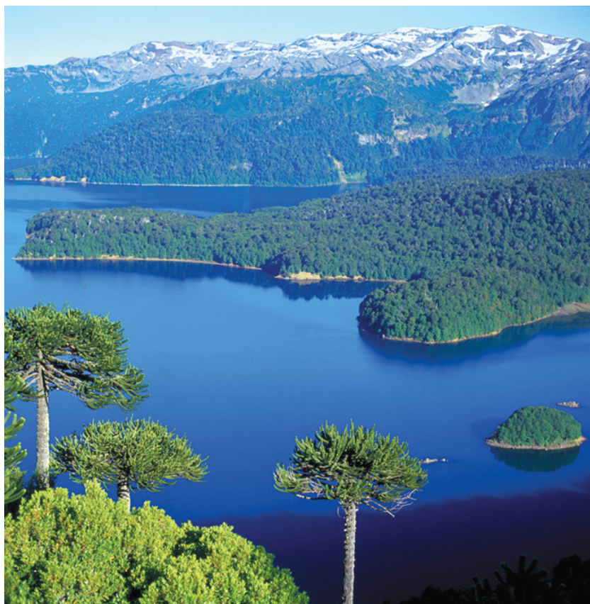
Fig.3 Archipiélago Juan Fernández. Chile

A finales del año 2005 la Red Mundial de Reservas de la Biosfera está constituida por 482 Reservas de la Biosfera, pertenecientes a 102 países, de los cinco